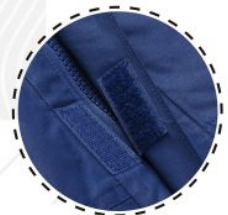
TAPETA CUBRE CIERRE