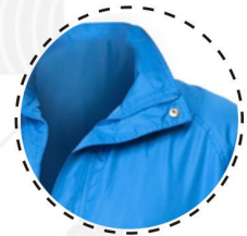
CIERRE DESMONTABLE CON TAPETA Y BROCHE

T-WORLD, es ropa corporativa de alta calidad, diseñada con estilo único, acompañando a los trabajadores y empresas de todo Chile.