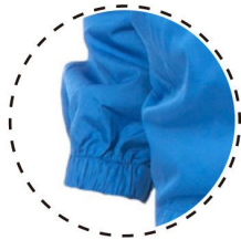
PUÑO DE MANGA CON ELÁSTICO