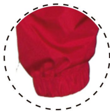
PUÑO DE MANGA CON ELÁSTICO