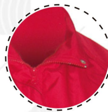
CIERRE DESMONTABLE CON TAPETA Y BROCHE

T-WORLD, es ropa corporativa de alta calidad, diseñada con estilo único, acompañando a los trabajadores y empresas de todo Chile.