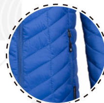
BOLSILLOS CON CIERRE

T-WORLD, es ropa corporativa de alta calidad, diseñada con estilo único, acompañando a los trabajadores y empresas de todo Chile.