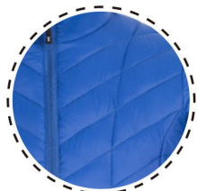
ACOLCHADO Eco-Light Windproof