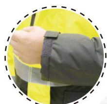
PUÑO INTERIOR EN TELA RIB Y VEICRO PARA AJUSTE