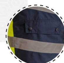
CINTA REFLECTANTE DE 5 CM DE ANCHO