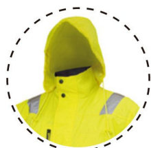
CAPUCHA INCORPORADA CON BOLSILLO EN EL CUELLO