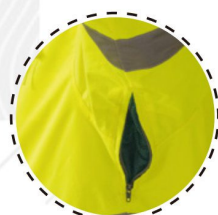
CIERRE Y MALLA PARA VENTILACIÓN